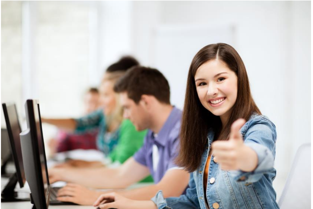
Version 7 – 2024

Die Webapplikation für die Planung, Verwaltung und Auswertung aber auch die Durchführung Ihrer Kurse, Lehrgänge und Seminare.